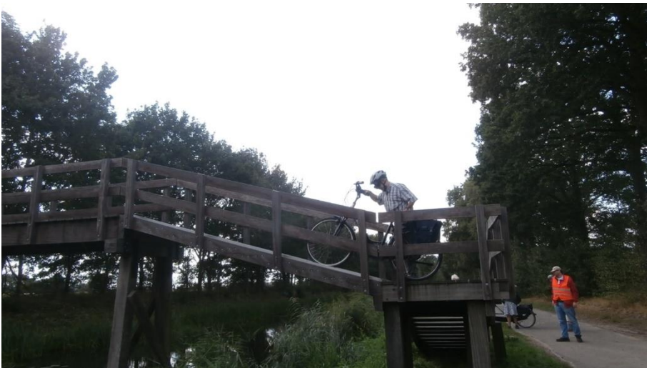
Lopend de brug over