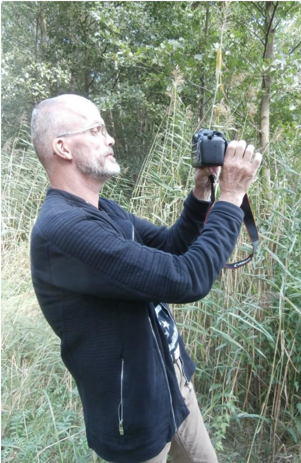
Onze fotograaf Eelco