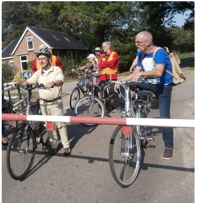
Wachten voor de brug